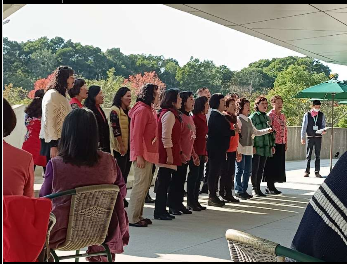
照片 4 說明 台灣客家文化館客家活動接待