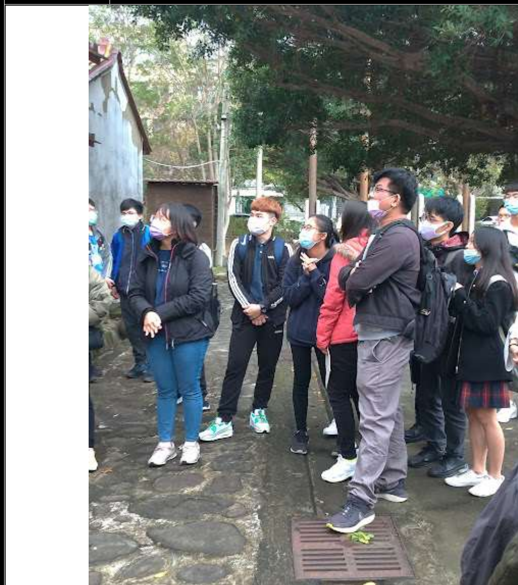
照片 2 說明 策展學生於六家問禮堂外合影